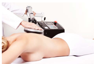
Bóle odcinka lędźwiowego