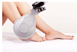
Bóle stawu skokowego

Cofnięcie się bólu, obrzęku, poprawa ruchomości, a w konsekwencji także jakości życia, często już po pierwszym zabiegu i utrzymujące się tygodniami, stanowi fenomen, którego nie notowała do tej pory fizjoterapia.